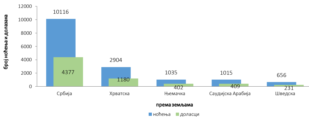
Табела 3: Доласци и ноћења туриста према класификацији дјелатности 1)