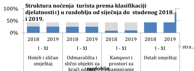
Tablica 3 : Dolasci i noćenja turista prema klasifikaciji djelatnosti 1)