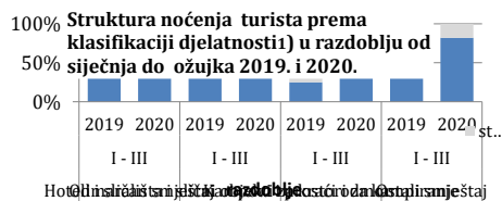
Tablica 3 : Dolasci i noćenja turista prema klasifikaciji djelatnosti 1)