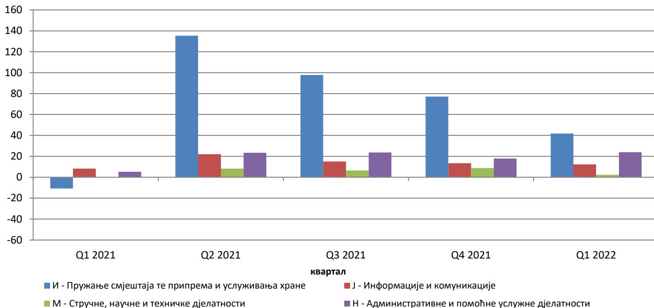
Годишње стопе промјене осталих услуга, календарски прилагођена серија БиХ

У структури оствареног промета осталих услуга (изворни, неприлагођени подаци) у првом кварталу 2022. године највеће учешће остварено је у подручју дјелатности информације и комуникације (55,7%), потом слиједе стручне, научне и техничке дјелатности (23,9%), пружање смјештаја те припрема и услуживања хране (10,3%), те административне и помоћне услужне дјелатности (10,0%).