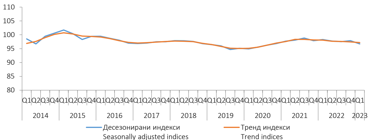
Графикон 1. Индекси производње у грађевинарству у БИХ, I Q 2014. - I Q 2023. Graph 1. Indices of production in construction in BIH, I Q 2014 - I Q 2023

Индекси, \emptyset 2015=100 Indices, \emptyset 2015=100