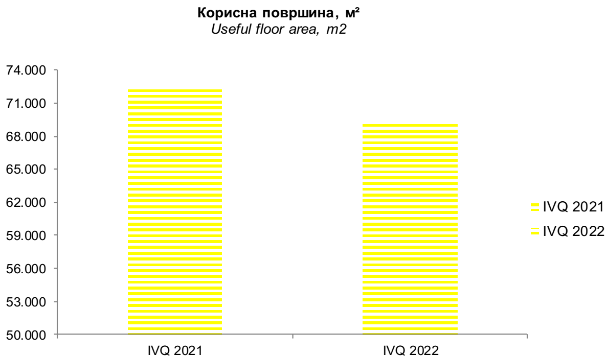
Figure 2: USEFUL AREA OF SOLD NEW DWELLINGS, 2021 AND 2022