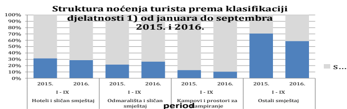
Tabela 3 : Dolasci i noćenja turista prema klasifikaciji djelatnosti 1)